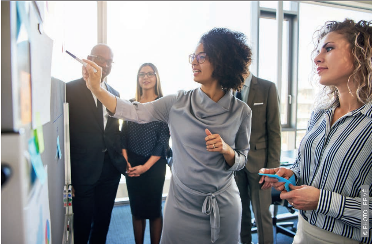
▲ Les entreprises qui adoptent une approche claire et transparente en matière de prévention et de protection au travail veillent davantage à la santé mentale de leur personnel.