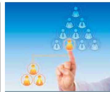
OUTSOURCING Tout le monde sous-traitant